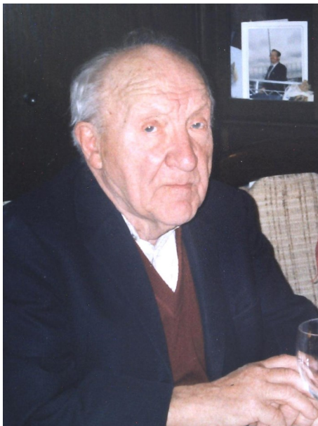
Op zijn 100ste verjaardag

Wie kent niet het pand van de familie Troch, dat zich uitstrekt van de Thaborstraat tot aan de Dobbelhuizen? Het leek ons boeiend een stuk familiegeschiedenis te leren kennen. Die voerde ons ook naar De Nieuwe Beggaardenstraat nr. 10, waar zich tot voor enkele jaren de Citroëngarage bevond.